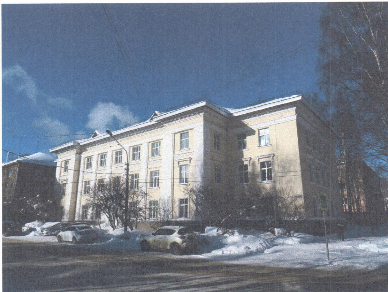
Общий вид памятника

Фотографическое изображение объекта культурного наследия регионального значения «Госучреждение» (уточненное наименование - «Управление лесного хозяйства Коми АССР и Лесная школа»), расположенного по адресу: г. Сыктывкар, ул. Карла Маркса, 210, включенного в единый государственный реестр объектов культурного наследия (памятников истории и культуры) народов Российской Федерации