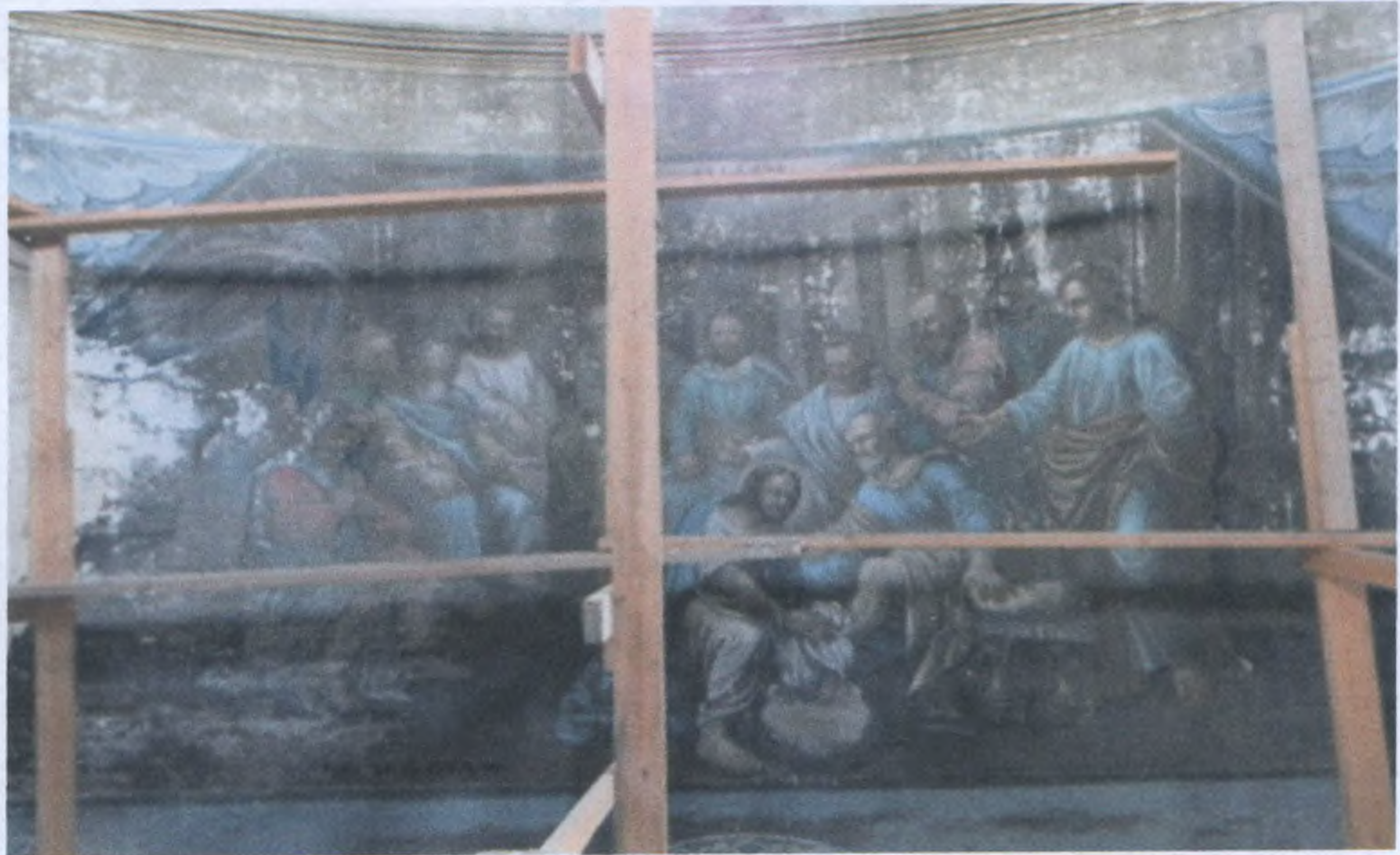
Интерьеры храма. Фрагменты сохранившихся фресок. Фото на момент проведения экспертизы.