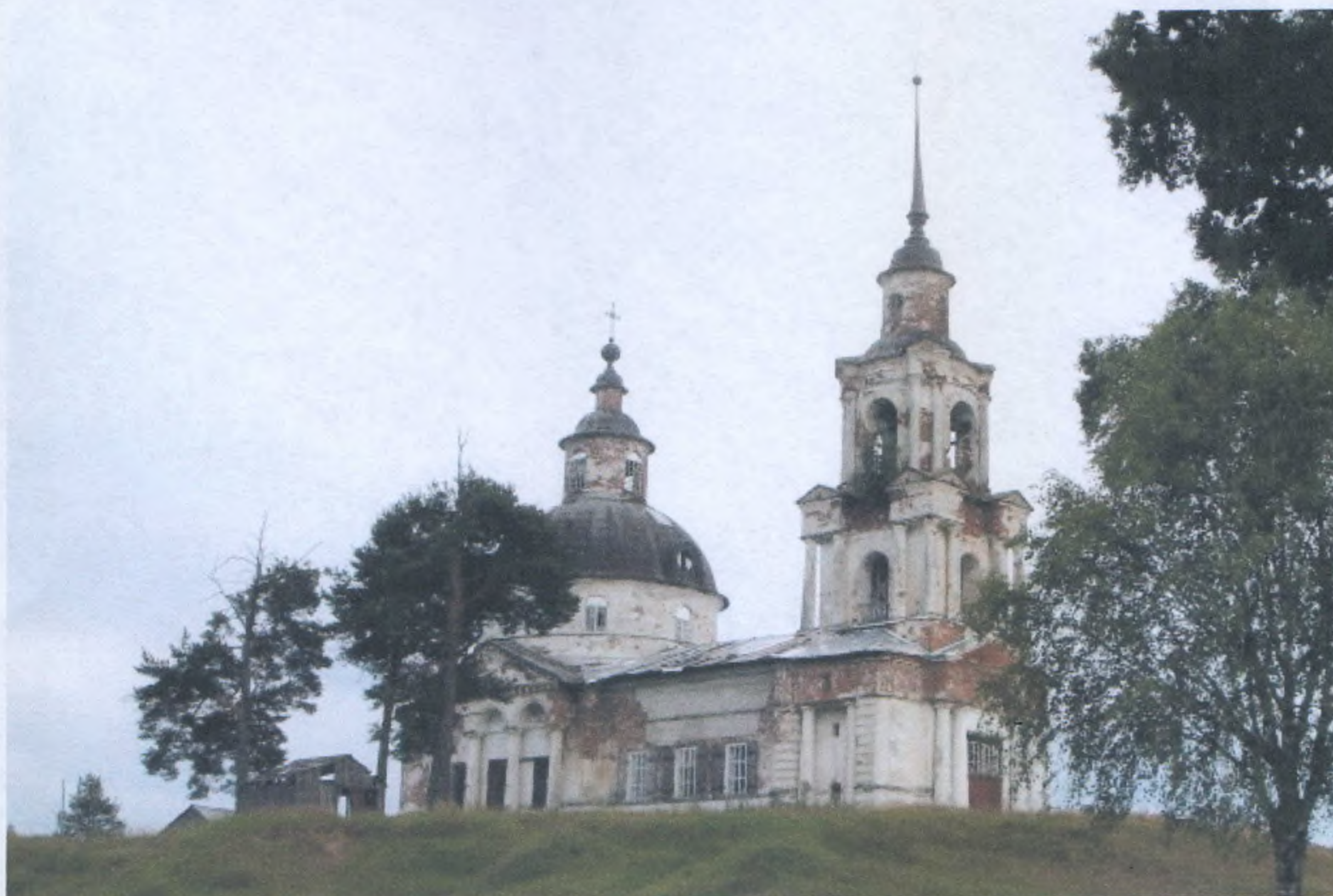
Вид с северо-западной стороны на Церковь святителя Дмитрия Ростовского. Фото на момент проведения экспертизы.