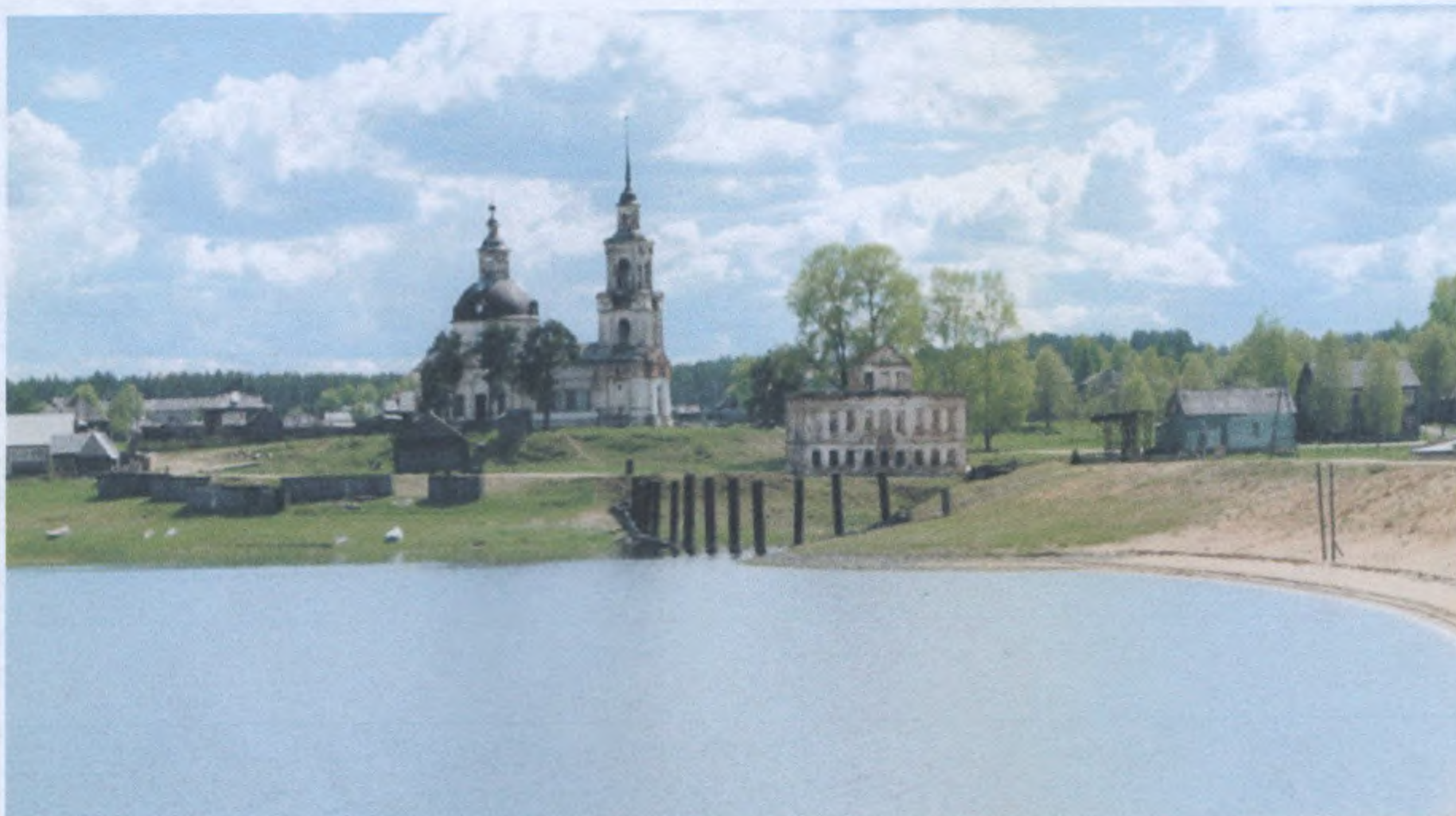
Кажымский чугунолитейный завод. Общий вид и церковь святителя Дмитрия Ростовского. Фото на момент проведения экспертизы.