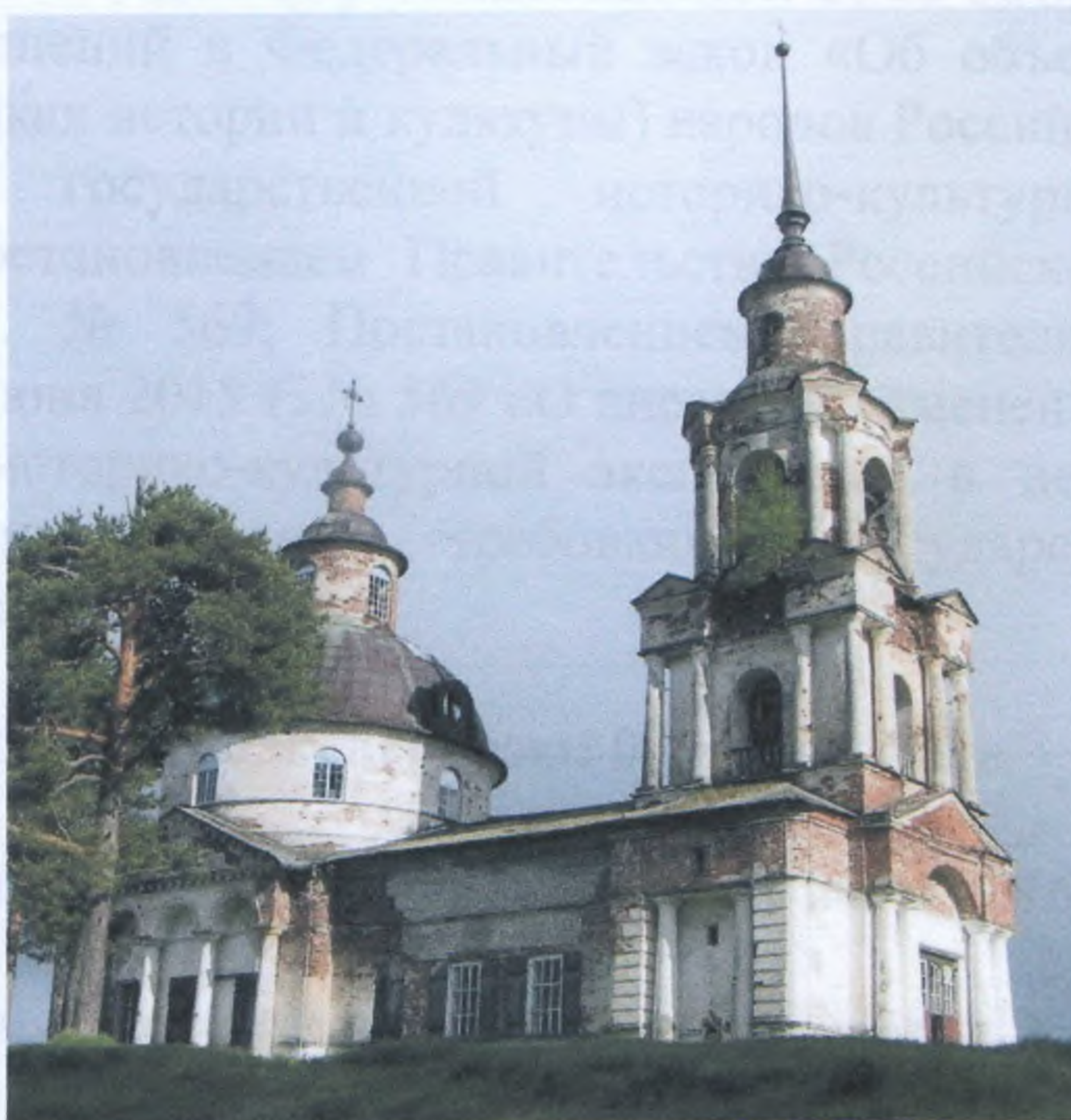
Церковь святителя Дмитрия Ростовского Республика Коми, п. Кажым.

государственной историко-культурной экспертизы документов, обосновывающих изменение категории историко-культурного значения и включение в единый государственный реестр объектов культурного наследия (памятников истории и культуры) народов Российской Федерации в качестве объекта культурного наследия федерального значения.