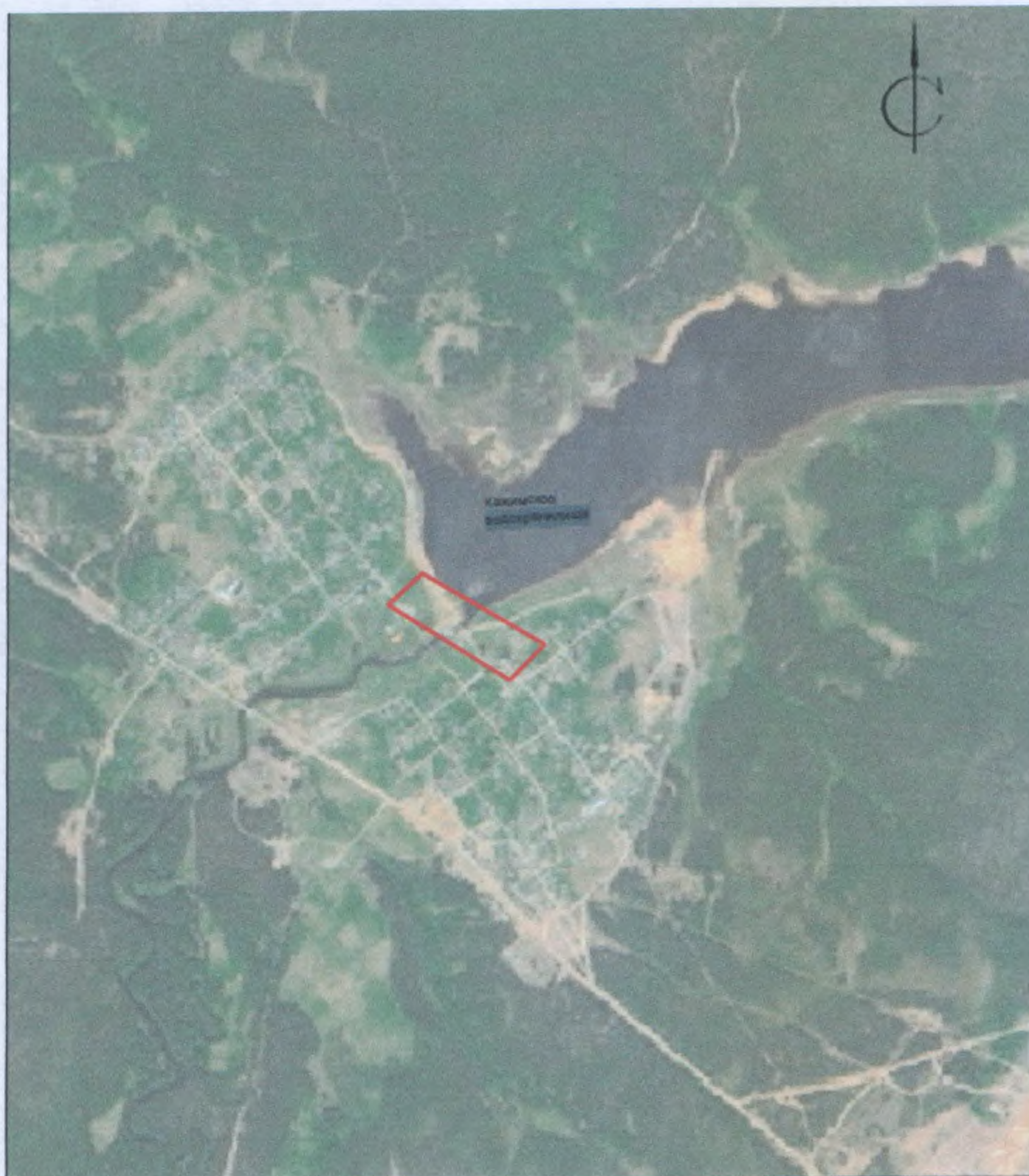
Участок расположения объектов культурного наследия

Ситуационный план размещения объекта культурного наследия федерального значения «Кажымский чугунолитейный завод, XVIII в. (доменная печь, др. сооружения)», расположенного по адресу: Республика Коми, Койгородский р-н, пос. Кажым», в том числе и объекта культурного наследия регионального значения «Здание бывшей церкви в п. Кажым Койгородского района (построена в 1826 году)».