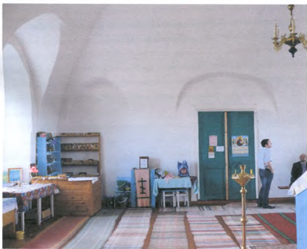
Восстановленный придел Дмитриевской церкви. Фото на момент проведения экспертизы.