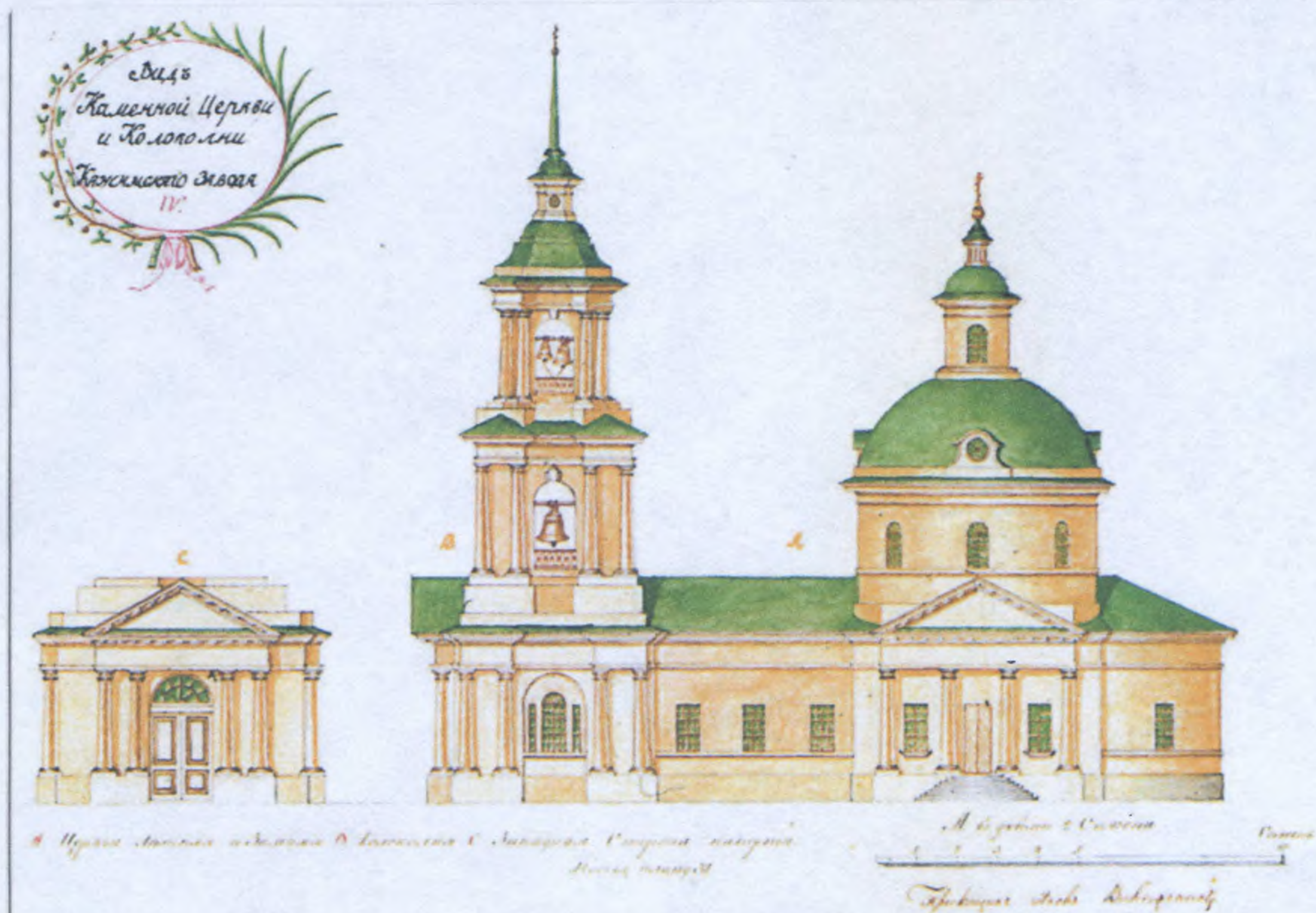
Вид каменной церкви и колокольни.